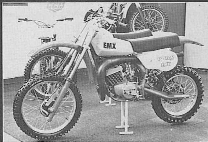
18. Duur, maar mooi, de EMX Cotton 250 cc crosser.